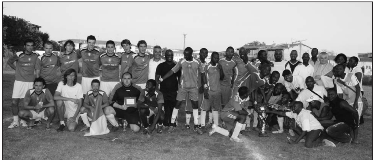
Italia e Nigeria al termine delle premiazioni.