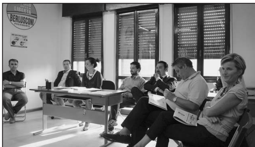
I partecipanti alla conferenza stampa.

I Consiglieri di minoranza dichiarano che non intendono creare intralci all'apparato amministrativo, ma purtroppo sono costretti a richiedere con frequenza documenti che spesso vengono negati, necessari per conoscere i problemi ed esercitare così al meglio il loro diritto