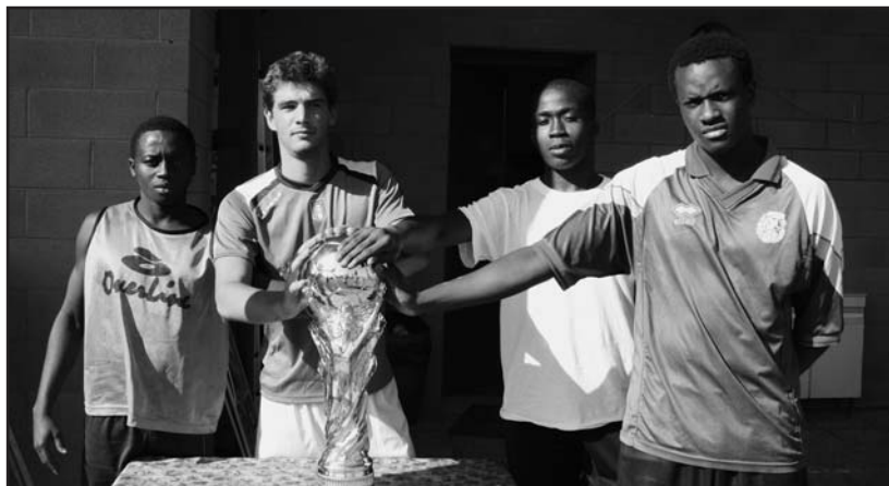
Le mani sulla coppa prima delle finali.