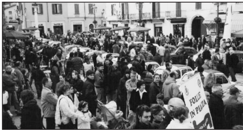
Follie in piazza (il mercatino degli sconti).

La Piazza S. Maria verrà adobbata con fiori e oltre una trentina di Comercianti esporranno su bancarelle colorate i loro prodotti a prezzi eccezionali. Durante il pomeriggio si esibirà un complesso di musica Rock (i FAKE SHADOW) i visitatori saranno accolti da numerose iniziative musicali e avranno l'opportunità di ammirare le numerose e bellissime Harley davidson che parteciperanno al primo