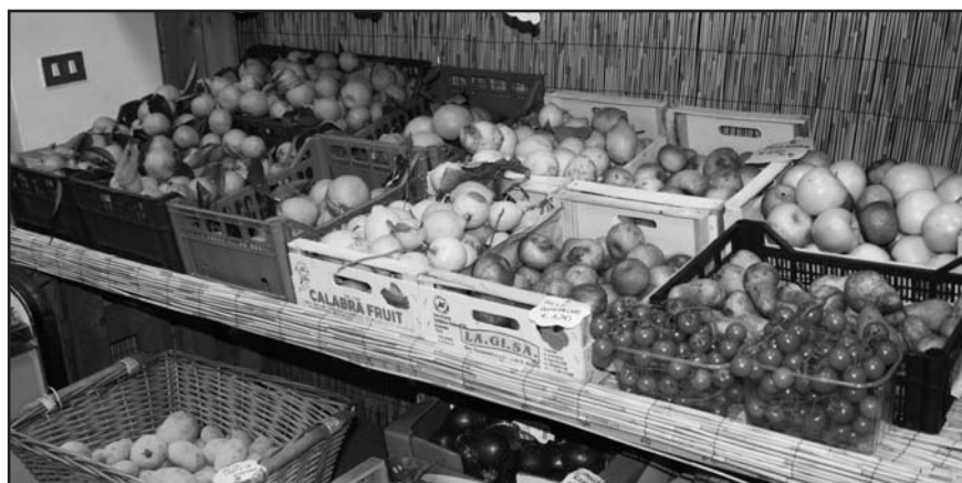
VERDURE DI STAGIONE: FRIARELLI ED ALTRE SPECIALITÀ CAMPANE