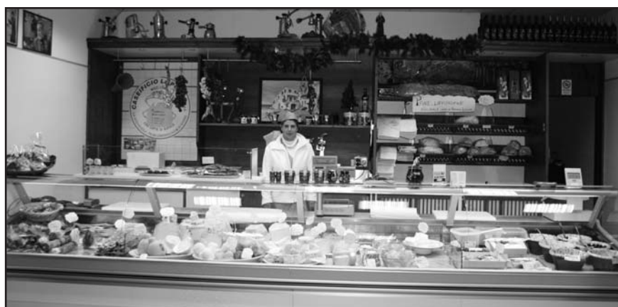
BANCO DI PRODOTTI FRESCHI - NUOVI ARRIVI MARTEDÌ E VENERDÌ - SI ACCETTANO PRENOTAZIONI