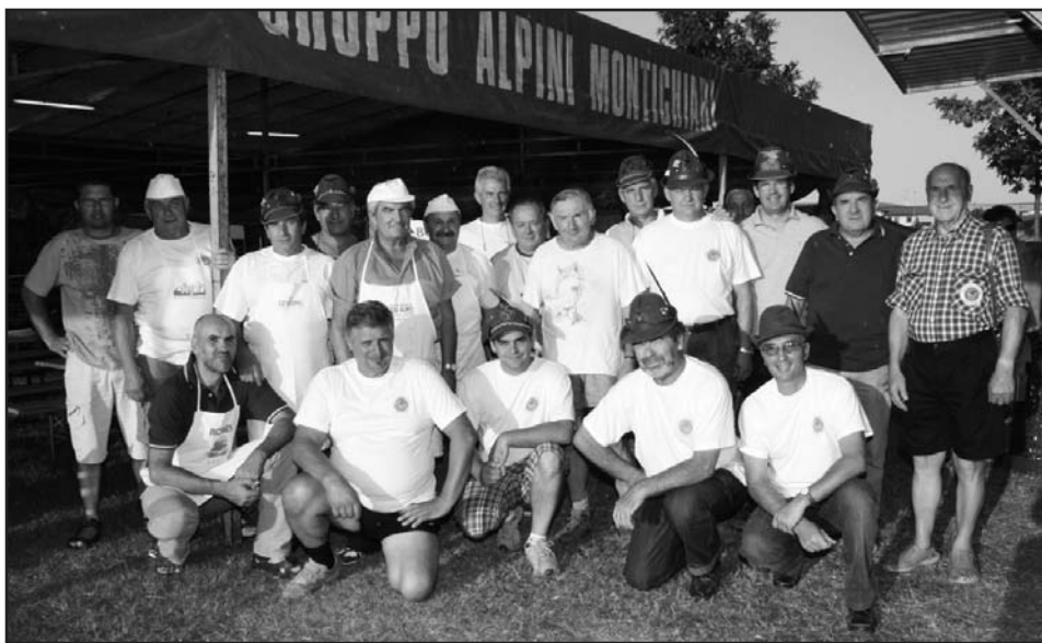
Il Gruppo Alpini organizzatore della festa.