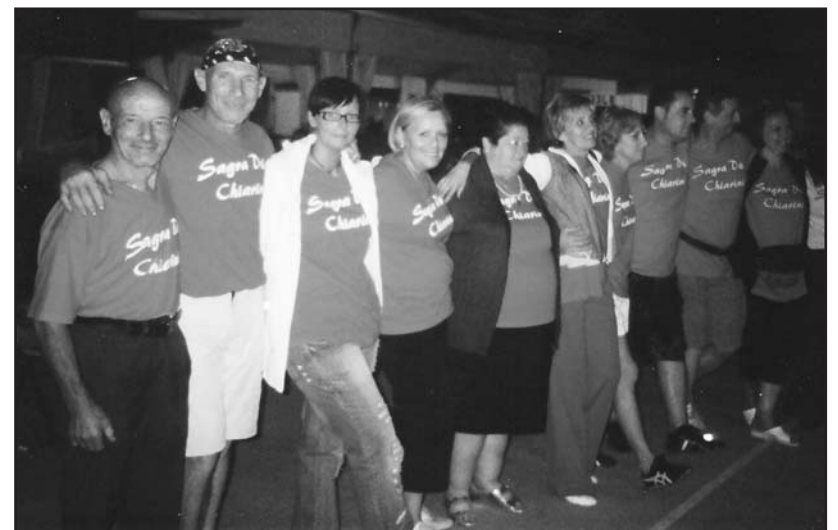
Alcuni volontari della Festa dei Chiarini.