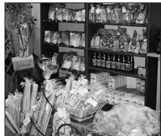
PANE, PASTA E DOLCI TIPICI NAPOLETANI

PRODOTTI FRESCHI ARRIVI MARTEDÌ E VENERDÌ